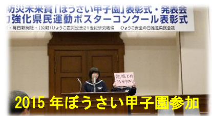
2015年ぼうさい甲子園参加