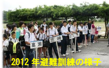
2012年避難訓練の様子

今日の4時間目に全校集会を開催し、東日本大震災について考えました。校長先生からは、『はるかのかのひまわり』の本の紹介を通して、「改めて人の命について考える機会にしてほしい」などの言葉がありました。自然災害に対する備え、地域づくりへの主体的なかかわり、さらに地域の方や友人への気遣いなど、今後も大切にしていきたいと思います。