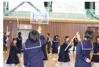
<呼吸を合わせキャッチ>