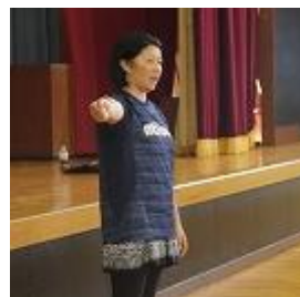
<演技指導の七尾東雲高池田先生>