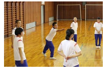
<無言で以心伝心ゲーム>