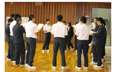
<男声パートの練習！>