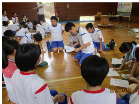
<「君の役割は」作戦会議>

強烈な暑さの中、恒例のサマーキャンプが8月8日(木)～9日(金)に、能登少年自然の家で行われました。体育祭の準備をしたり、親睦を深めたりして、有意義な時間を過ごしました。