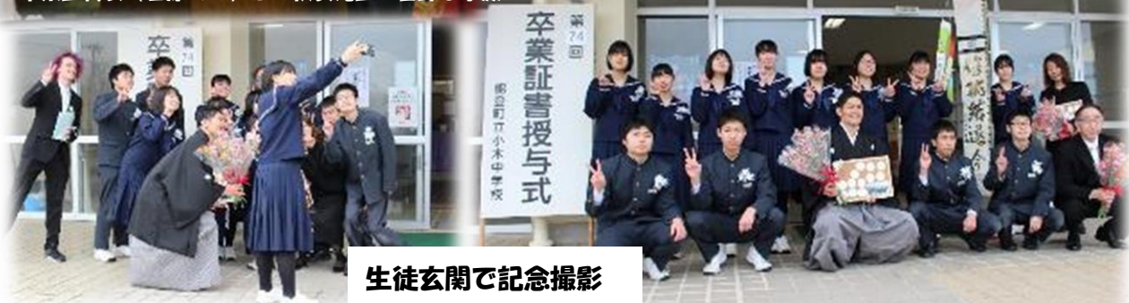
生徒玄関で記念撮影