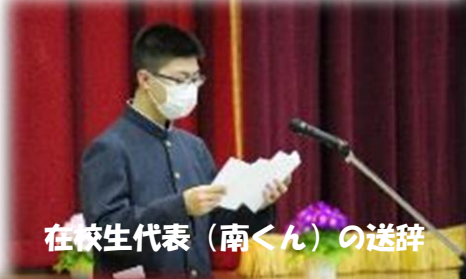
在校生代表(南くん)の送辞