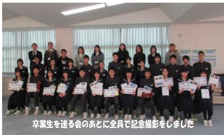
卒業生を送る会のあとに全員で記念撮影をしました

この1年間で子どもたちは一段とたくましくなり、心身ともに大きく大きく成長しました。4月から在校生はひとつ上の学年に進級し、3年生は進学します。それぞれ新しい学年・学校でさらに飛躍してくれるものと信じています。保護者の皆さま、地域の皆さまには、この1年間本校の教育活動にご理解とご協力をいただきありがとうございました。来年度も変わらぬご支援をお願いいたします。