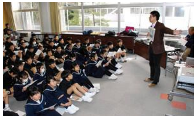
新聞記者の出前講座に耳を傾ける児童たち ＝1/16 北陸中日新聞朝刊の記事より＝

新聞を教材として活用するNIE（Newspaper in Education）の事業が全国各地で行われています。本校では、5年生が新聞社で働く人のお話を聞かせてもらう講座を開催しました。新聞記者の1日や新聞を作る流れを教わり、記者としての仕事で大切にしている思いを語っていただきました。「去年、1日だけ朝四時から働いた日はいつでしょう。」などのクイズもあり北陸新幹線開業時の取材の苦勞を聞きました。また、取材した記事が架け橋になった喜びも教えてもらいました。どの子も新聞記事を作る苦勞や記者の思いをしっかりと受け止められたようです。新聞ができるまでの手順を理解するだけでなく、職業への熱い思いを知ることができました。子ども達はこれから新聞を読むときに、きっとこの学習を思い出すことでしょう。