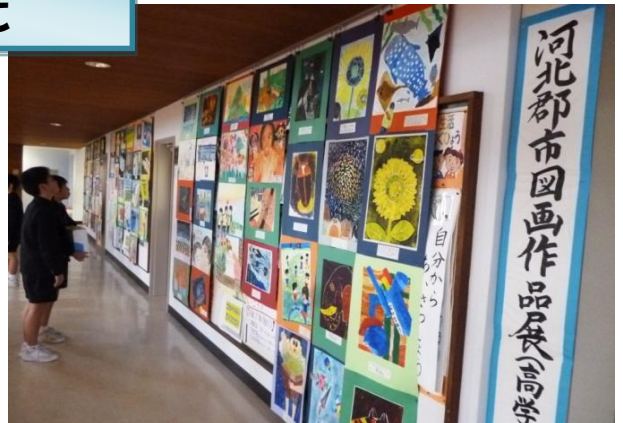
【郡市回画作品展・書写作品展】3市町20校の代表作品を、全小学校で巡回展示しています。（回画は低中高、書写は低高に分けて）よい作品を見ると心が動きます。