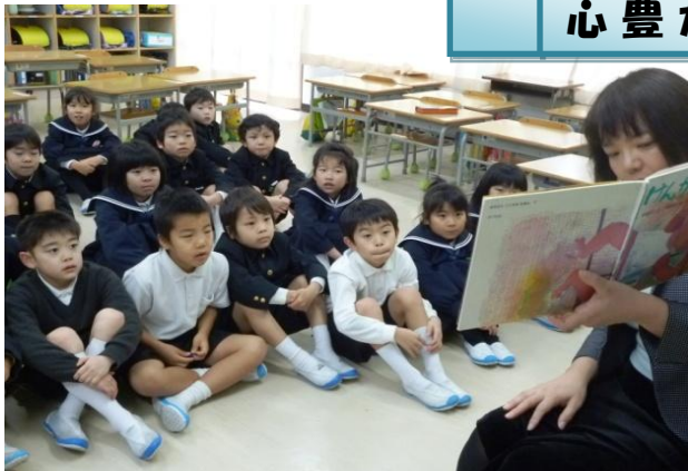
【人権意識を高める読み聞かせ】これまでに2回、担任以外の職員が、各学級の朝学習の時間に心に響くお話を読みました。いつも以上に真剣に聞いていました。