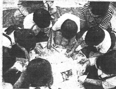
キャンドル作り (2年生)