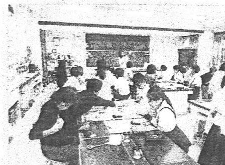
コサージュ作り (6年生)