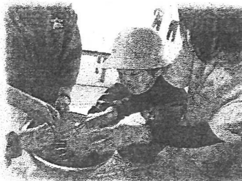
まきまきパン生地作り

この体験学習を通して、自分達の強みや良さが分かるとともに、弱さや足りない力も分かってきました。この活動で得たことをきっとこれからの学校生活や家庭生活に活かし、さらに成長していってくれるでしょう。