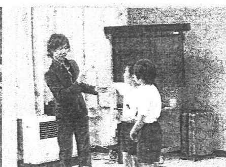
親子でマジック体験 (5年生)