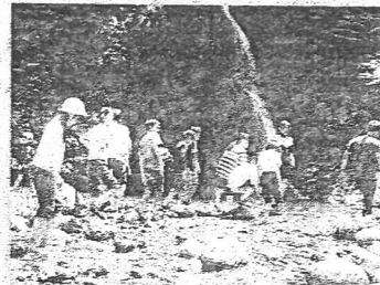
三蛇ヶ滝付近の沢遊び