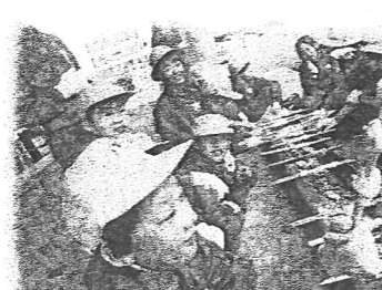
まきまきパン炭火焼き