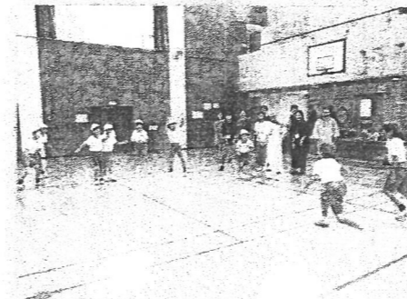
ドッチビー大会 (3年生)