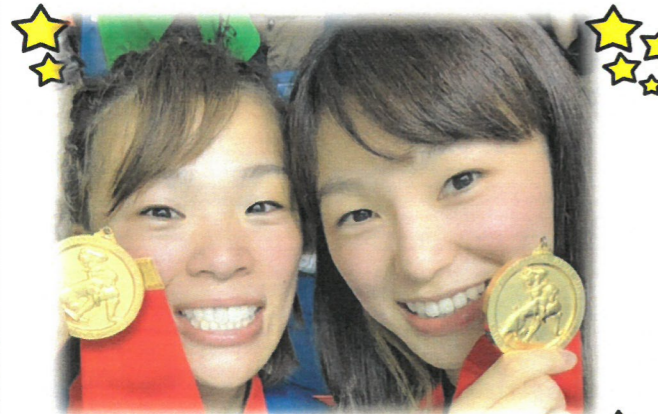
姉妹でがんばれ! 世界選手権 (9月14日～ カザフスタン開催)