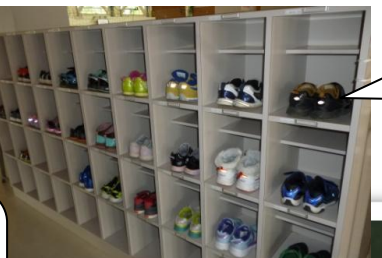
整頓のできている下足箱