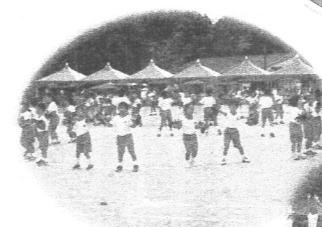
1. 2年表現 パプリカ～勝利のたねをまこう～