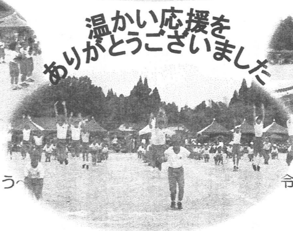
3. 4年表現 令和元年太白っ子ソーラン