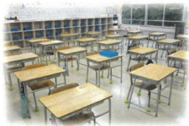
机の間隔を空けた4年教室