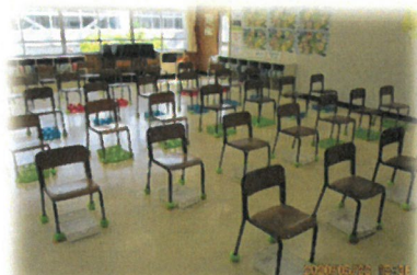
隣同士を大きく離れた音楽室