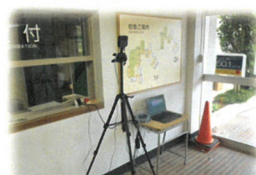
町購入のサーモグラフィシステム