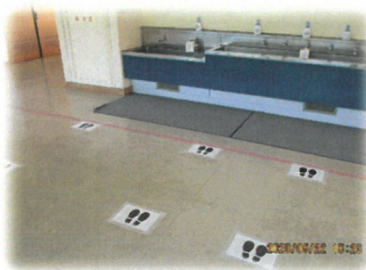
距離感を意識させる足型