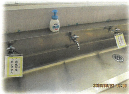
一つ飛ばしで使用する蛇口