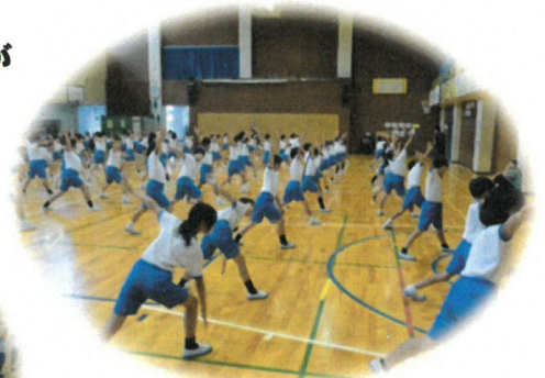
3. 4年表現練習 心一つに力強く舞え ～太白ソーラン～

今年の運動会は、コロナウィルス感染症拡大防止の観点から規模を縮小し、平日の午前で開催することとなりました。このような状況の中、当初は開催も危ぶまれ、子どもたちも教職員も「この行事もか。」と心配をしていました。しかし、保護者や地域の皆様、関係各位のご理解ご協力もあり、なんとか開催できることになりました。ありがとうございました。