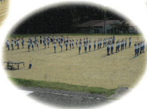
5. 6年表現練習 集団行動 2020