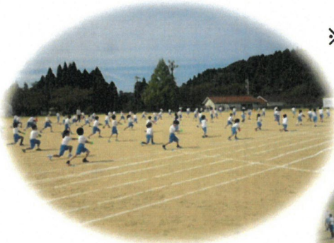
1. 2年表現練習 太白っ子手洗いダンス