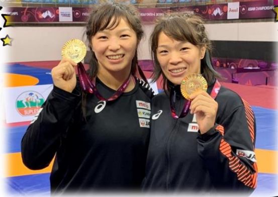
姉妹でがんばれ! オリンピック

本校の卒業生でリオ五輪女子レスリング金メダリスト川井梨紗子選手(平成18年度卒業)と妹さん友香子選手(平成21年度卒業)が、姉妹そろってのオリンピック出場となり、試合本番まで2週間あまりとなりました。わくわくしますね。