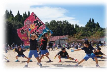
3, 4 年生：太白ソーラン 2021