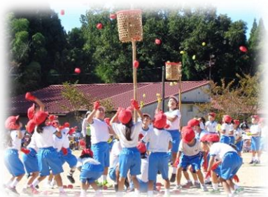
1, 2 年生：ダンシング玉入れ

5, 6年生（応援係は4年生も）の係の活躍のおかげで、大成功で終わることができました。ありがとうございました。