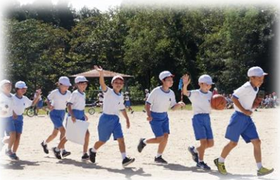
5, 6 年生：太白オリパラ 2021