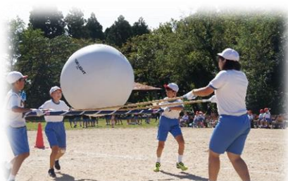
5, 6 年生：太玉運び