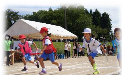
1～6 年生：チーム対抗リレー