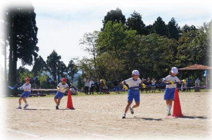
3, 4 年生：太白っ子タイフーン