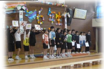
送る会を支えてくれた 5年生