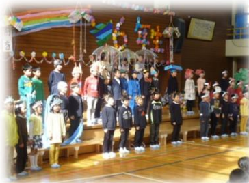
2年生「太白山のなかまたち」