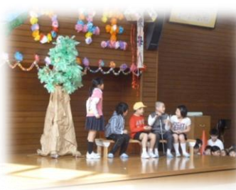
4年生 「プラタナスの木」