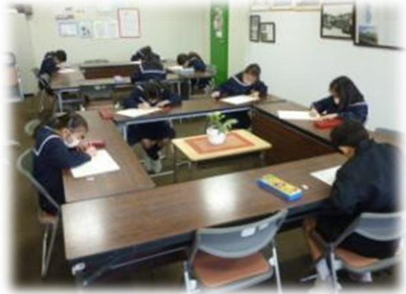
都道府県名人にチャレンジする4年生 (校長室)

基礎的な力の定着を図る目的で、1月の下旬から、4年生は都道府県名人、2年生は九九名人にチャレンジしています。 まず、それぞれの教室で合格できたら校長室に来て認定試験を受ける資格ができます。 九九の試験は、3分以内にばらばらの九九カードを間違えずに言い終えたら名人に認定です。都道府県名人は、15分以内に47都道府県を正しい漢字で書き終えたら認定されます。 教室ではすらすらできるのに、校長室に来ると緊張して思うように力を発揮できない子もいます。 3学期が終わるまでには、全員が名人になってくれることを願っています。