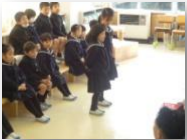
歓迎の言葉を言う代表