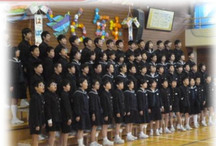
6年生「YELL・笑顔にあえる」