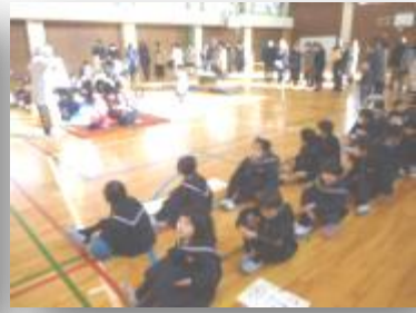
体育館で得意技の発表

2月16日(木)来年度入学予定の園児さんを招いて「新1年生を迎える会」が開かれました。 1年生は、この日のためがんばって準備をしてきたのですが、2組が学級閉鎖のため1組の子どもたちで迎えることになりました。それでも、子どもたちはしっかりと活動してくれました。一人で三人の園児さんを相手している子もいました。とても少ない人数の中よくがんばりました。