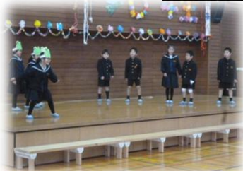
1年生「おとどけもの」