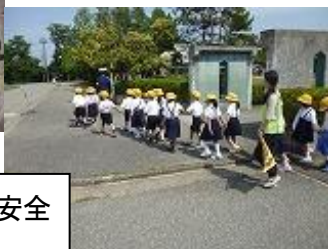
実際に歩いて交通安全について学びました。