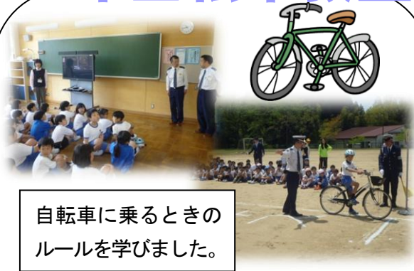
自転車に乗るときのルールを学びました。

1年生の交通安全教室に引き続き、3年生の自転車教室が行われました。正しい自転車の乗り方や安全の確認の仕方を学びました。練習したことを忘れずに、安全に乗るようにしましょう。この教室が終了した後からは、子どもだけで自転車に乗ってもよいこととなりますが、自転車に乗るときはヘルメットをかぶるようにご指導お願いします。