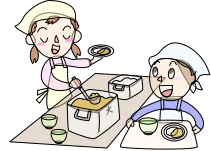
協力して給食の配膳