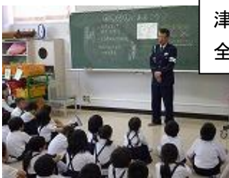
津幡署の方から交通安全のお話を聞きました。

5月2日(火)に1年生の交通安全教室が行われました。津幡署のおまわりさんから安全に道路を歩くためのお話を聞いた後、実際に道路を歩いて横断歩道の渡り方や踏切の渡り方、信号機のある交差点の渡り方などについて学びました。暑い日でしたが、子どもたちは1時間強のコースをしっかりと歩き通すことができました。