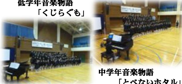
中学年音楽物語 「とべないホテル」