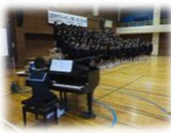
高学年合唱 「ありがとうの約束」 「いつか この海をこえて」