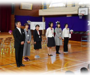
新任の先生方との対面

春のうらかな日差しの中，たくさんの来賓と保護者の方に出席していただいて平成30年度の入学式が行われました。とても元気な61名の新入生で，呼名の返事やあいさつもしっかりとできていました。これから大きくたくましく育つよう，職員一同全力で指導していきたいと思っています。ご協力よろしくお祈いします。