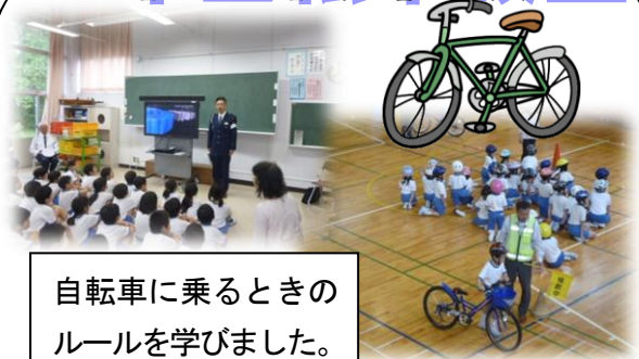
自転車に乗るときの ルールを学びました。

1年生の交通安全教室に引き続き、3年生の自転車教室が行われました。正しい自転車の乗り方や安全の確認の仕方を学びました。練習したことを忘れずに、安全に乗るようにしましょう。この教室が終了した後からは、子どもだけで自転車に乗ってもよいこととなりますが、自転車に乗るときはヘルメットを着用するようご指導お願いします。