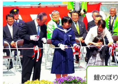
鯉のぼりフェスティバル