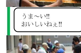
うま〜い!! おいしいねえ!!