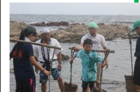
みんな手慣れたものです。