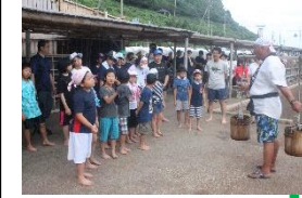
②かえ桶で海水を運び、しこけへ入れます。