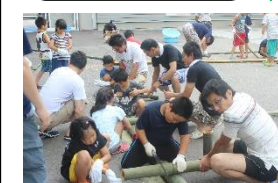
④お待ちかねのながしそうめんです。台も器も保護者の皆さんと一緒に作りました。