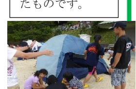
⑨お泊り用のテントも自分たちで張ります!!