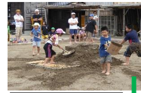
⑧集めた砂を次の塩づくりのためにまたまきまきすみんな手慣れたものです。