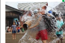
見てください、このテクニック!! カッコいい!!