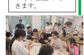
⑪みんなで食べるカレーはうまい!!