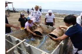
⑦さらに海水をかけると、濃〜いかん水がとれるのです!!