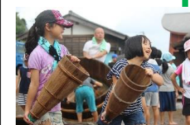
③おちよけで海水をまきます。