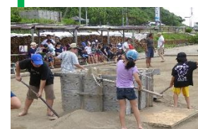
⑥集めた塩をしっぱつを使ってたれ舟に入れます。砂をたくさんすくうには技術がいります。