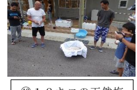
⑬12キロの天然塩の出来上がりです!!