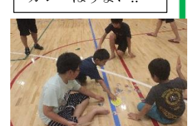
⑫青年福祉委員さんとめんこ遊び!!