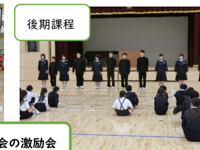
陸上大会の激励会