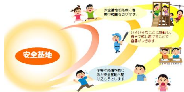
石川県教委パンフレット「お子さんの安全基地になっていますか」より

明日からの夏休みは、学校での生活時間が短くなり、ご家庭や地域で過ごす時間が増えます。言い換えれば、家庭や地域で成長する機会が増えるということです。以前にお伝えしたことがあります、夏休みに入るにあたって次のことに心がけてはいかがでしょうか。