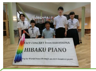
被爆ピアノコンサート9年生