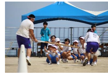
台風目（風をおこせ）