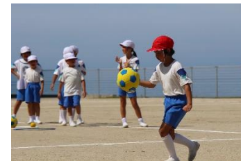
ボール運び（慎重に）