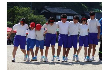
N脚リレー（息を合わせ）