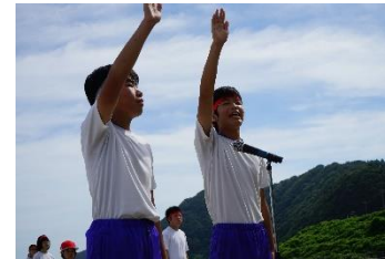
団長による選手宣誓