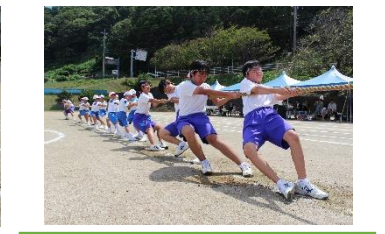
綱引き（今年は白の勝ち）