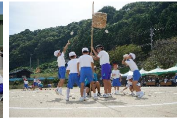
玉入れ（たくさん入ったね）