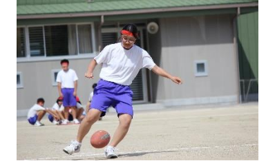
行き先はボールに