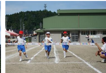
1年生は初めての運動会