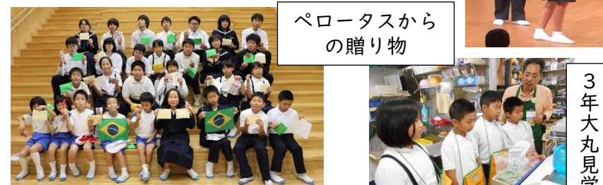
ペロータスからの贈り物