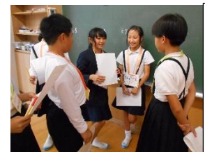
と4年宝立小中交流授業

「いしかわ教育ウィーク」学校公開 期日：11月1日、2日、6日、7日 時間：8：10～16：40 ※2日は文化祭終了までみなさまのご来校お待ちしております。