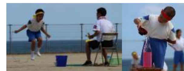
(新種目) ミッション水運び