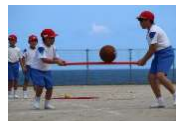
(新種目) 協力して運ぼう