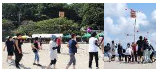
(新種目) P T A ダンシング玉入れ