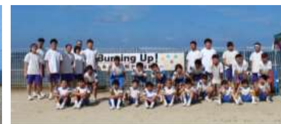
みんなで創りあげた運動会