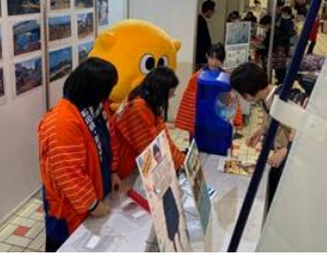
11/2, 3 つながる石川テレビまつり 115個完売! かつての仲間も応援に!