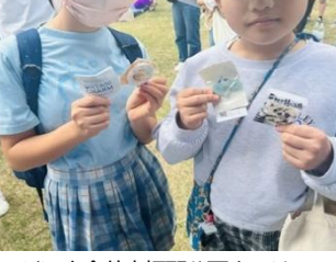
10/27 小井市榎野公園まつり 30個完売!小さい子たちに大人気