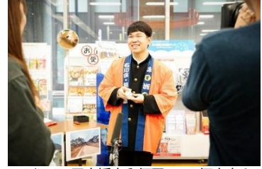
10/23, 24 日本橋南郵便局 100個完売!日テレ、フジテレビにも出演!