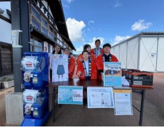
10/13 すずなりで販売 70個完売大谷チャームデビューです!