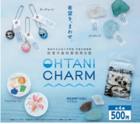
プロの方のご協力で、素敵なポップができました!