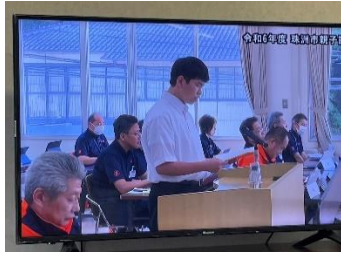
7/31 珠洲市親子議会にて提案道の駅などに置かせてもらうことに

本年度は、児童生徒の地元大谷を思う気持ちが、「大谷チャーム」という一つの形になり、たくさんの皆様のたくさんのご協力を得て、活発な活動をさせていただいております。ありがとうございます。