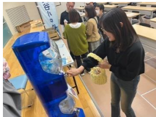
10/19, 20 金工大祭 80個完売!体験コーナーもありました!