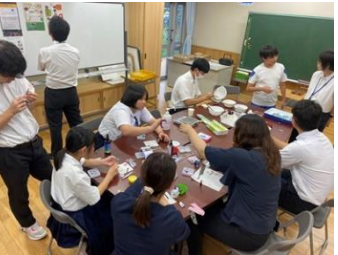
いろいろな時間を利用して、みんなで作成しました