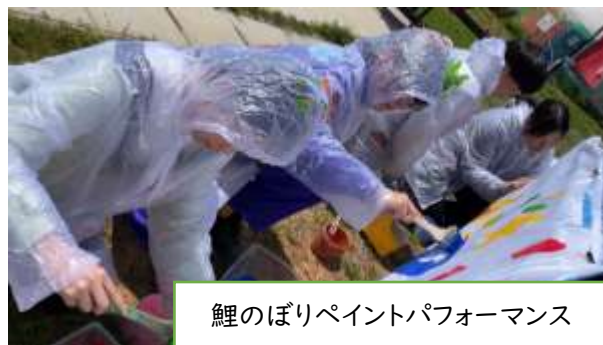
鯉のぼりペイントパフォーマンス