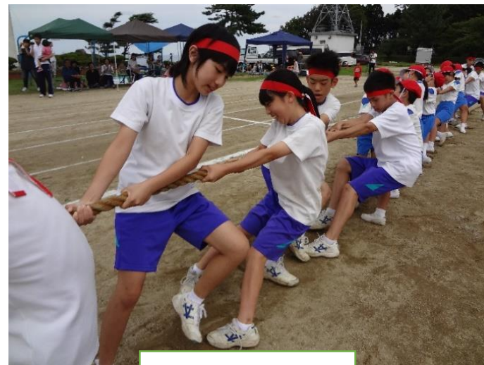
小中による綱引き