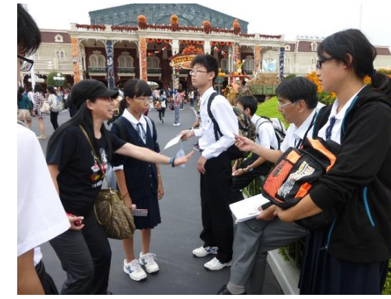
ディズニーランド