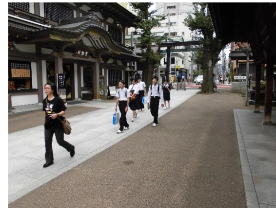
湯島天満宮 合格祈願