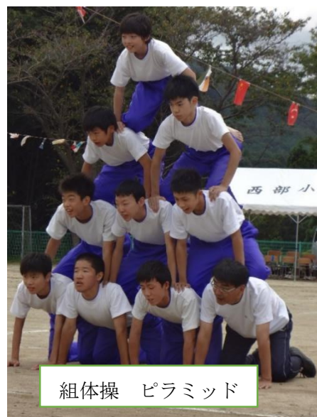
組体操 ピラミッド