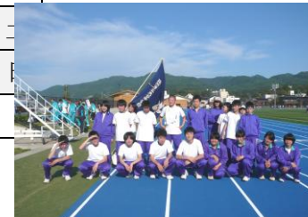
5月23日陸上競技大会(輪島にて)

会場：田鶴浜体育館(バスケット) 試合：A5 1回戦 御祓中(14:20~) 二回戦からは部活動の案内をご覧ください。 卓球の会場は七尾市総合体育館で組み合わせは未定です。(卓球は15、16日)