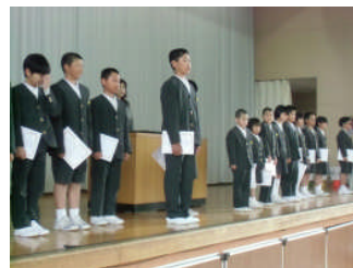
ステージにならんだ委員長と学級

任命された全員が、学校や学級のリーダーとしてがんばることができるように、まわりの人たちもよい学校づくりのために支えられるとよいですね。