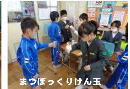
まつぼっくりけん玉