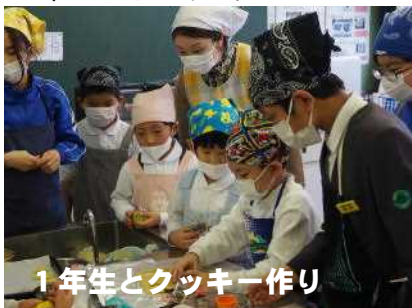
1年生とクッキー作り