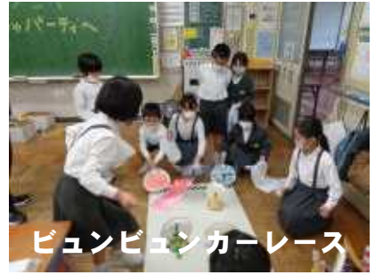
ビュンビュンカーレース