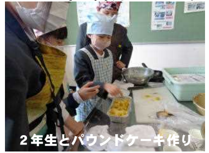
2年生とパウンドケーキ作り

1・2年生が収穫したさつまいもを使ったメニューを6年生が準備し、それぞれ一緒に調理しました。6年生の姿を見たりアドバイスを受けたりして、1・2年生も調理や後片付けをしました。また、新聞紙をのりやセロテープ等を使わずに、どれだけ高くできるかを競って楽しんでいました。