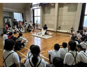
<キゴ山研修センター子ども交流棟>