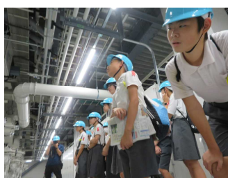
<北國新聞白山印刷センター>