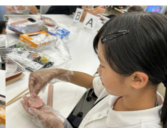
<観光物産館、和菓子作り>