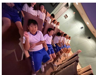
<キゴ山・プラネタリウム、朝食>