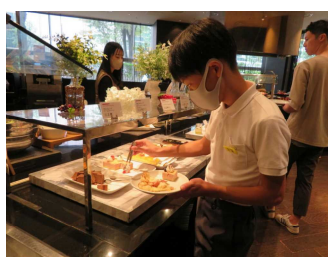
<ランチ・ビュッフェスタイル>