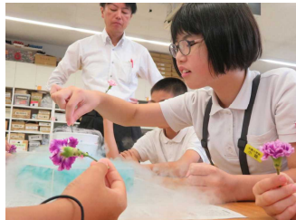
<サイエンスヒルズこまつ>