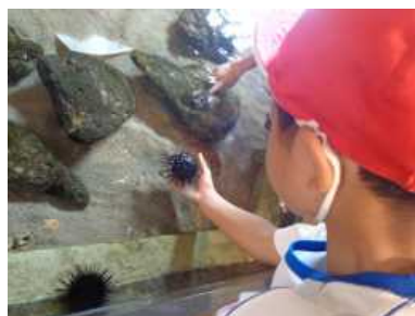
<のと海洋ふれあいセンター>