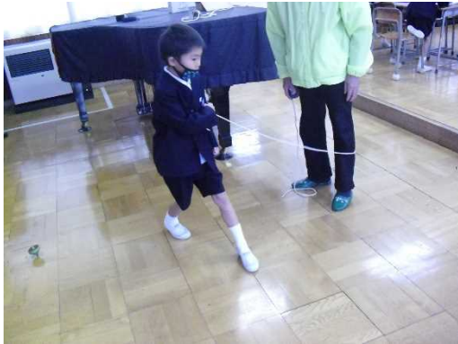
コマ回しで遊ぶ児童

コマまわし、福笑い、けん玉、お手玉、メンコ、陣取りゲームなど、今の子どもたちには、あまりなじみのないような遊びをボランティアの皆さんと一緒に楽しみました。