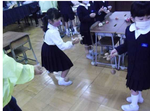
けん玉を楽しむ児童