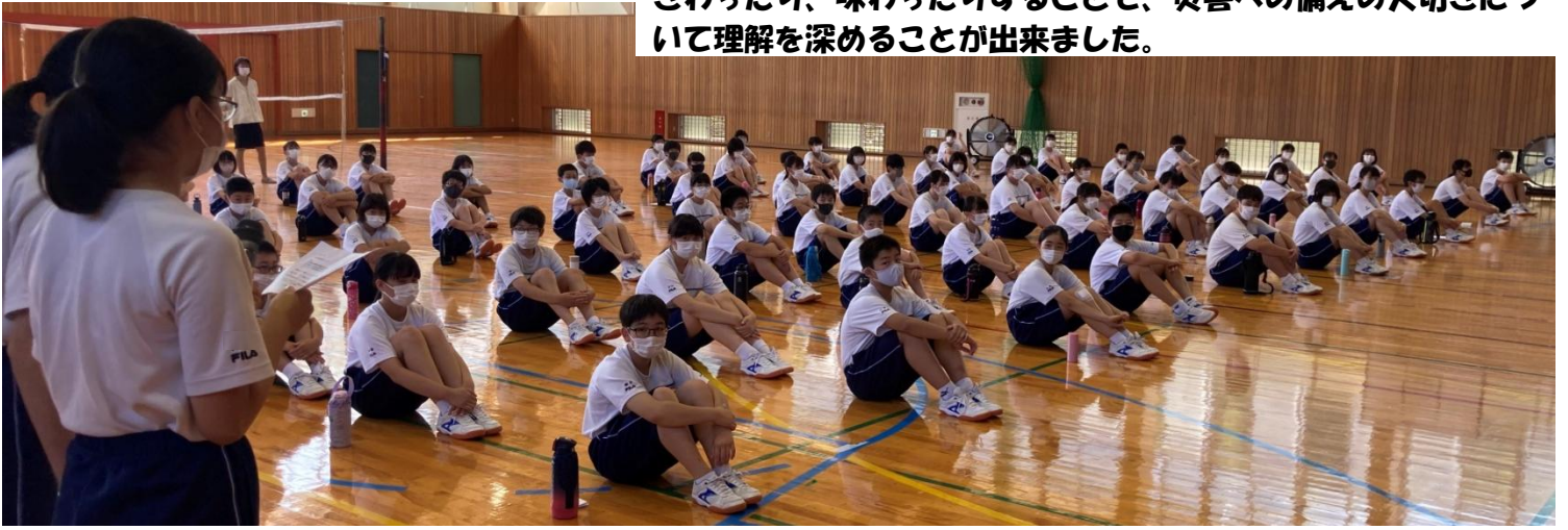
釜石の奇跡(ビデオ視聴)

生徒一人一人の防災意識を高めるために3年生の総合的な学習の防災グループが中心となり企画、運営をしました。実物を見たり、さわったり、味わったりすることで、災害への備えの大切さについて理解を深めることが出来ました。