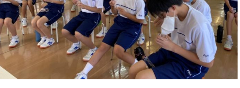
避難所としての学校の機能