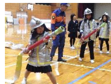
↑ 左から〔認知症講座(4年総合)・リコーダー演奏「ラルゴ」(3年音楽)・人権委員(6年)・消防署員(3年社会)〕