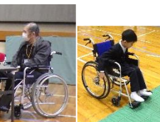
↑ 左から「着物リメイク会(6年家庭)・読み聞かせ「ボランティアズ」・クラブ活動・肢体障害講座(4年総合)」