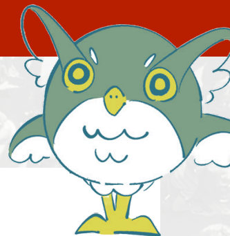
本校キャラクターみみい