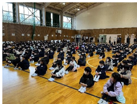
【体育館での3学期始業式】