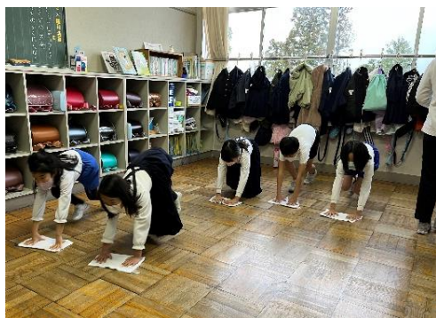
【きれいに並んで教室掃除】

3学期は、1～5年生は52日、6年生は48日と登校数が非常に短い期間です。学習面では学年のまとめを行い、次学年へ進級するための準備をする大切な時期でもあります。また、運動面ではなわとび大会に向け体育の時間や休み時間に練習を重ね、児童の体力向上に努めてまいります。いずれにせよ学校では引き続きコロナの感染予防を徹底した上での取組となりますので、保護者の皆様におかれましてはご協力の程よろしくお願いいたします。