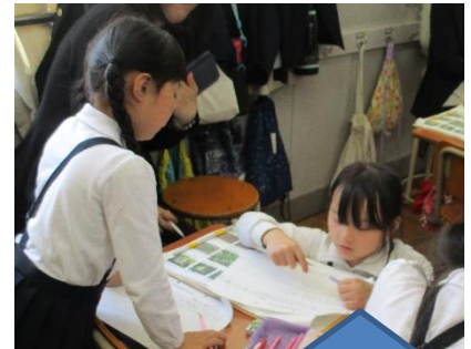
2年 国語「たんぼぼ」 自分で読み取り、まとめたことを交流