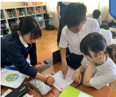
6年 算数「分数のたし算」 子どもに委ねる時間をより多く

作見小学校では、 楽しい授業は自分でつくる みんなでつくる を合言葉に、まずは、子どもたちの学ぶ意欲をどう高めていくか、日々取り組んでいます。また、市教育委員会の伴走チームの支援を受けながら、学年に応じて新しい学習形態にもチャレンジしています。子どもたちの「わかる」「できる」を増やし、子どもたち自身がしっかりと考え、学びを楽しむ学校に……。