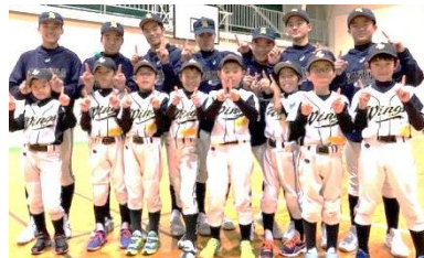
「学童野球対象の少年野球教室」

心の持ち方、考え方、取り組む姿勢を磨くための体験活動を積極的に行っているのが野球部の特徴です。