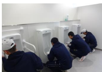
「トイレと心を磨く会」