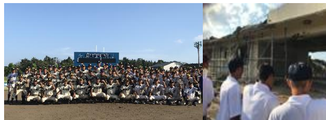
「東日本大震災被災地支援事業」(宮城県)