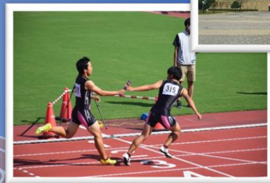
北信越高校新人大会（新潟）