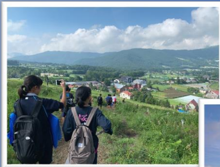
夏季強化合宿 菅平（長野県）