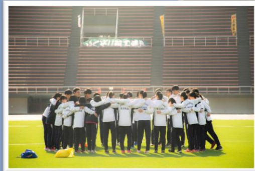
石川県高校総体 西部緑地公園陸上競技場