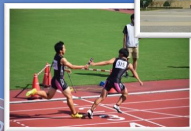
北信越高校新人大会