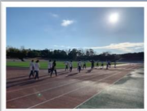
冬季強化合宿（大阪）