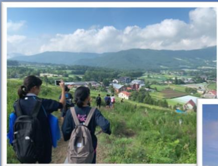
夏季強化合宿 菅平（長野県）