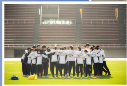
石川県高校総体 西部緑地公園陸上競技場