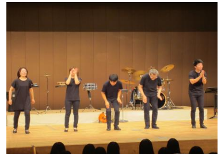
【一緒にボディパーカッション】

また、後半には全生徒が総立ちでボディパーカッションに参加するなど、大変盛り上がりました。先生方からも「集合時間や鑑賞態度など、とても良かった」との声が多く聞かれ、とても楽しい『文化教室』でした。