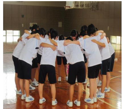
【円陣を組むバレー選手】