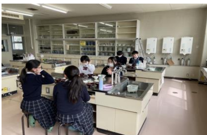
レンコン料理の提案のため、調理実習も