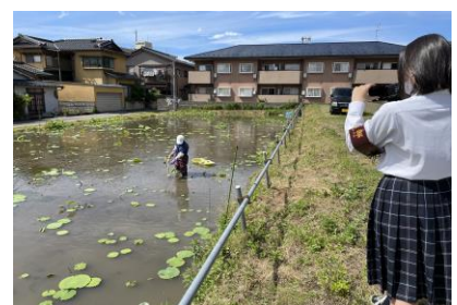
レンコンの生産者の方を取材しています