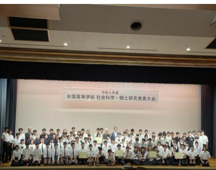
全国高等学校社会科学・郷土研究発表大会