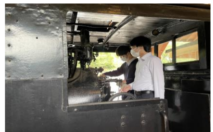
ぼっぼ自動車展示館見学