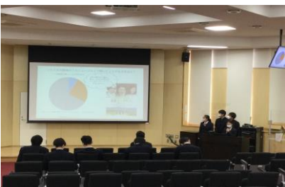
秋季合同研究発表会