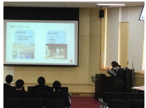
冬季合同研究発表会