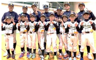
「学童野球対象の少年野球教室」

心の持ち方、考え方、取り組む姿勢を磨くための体験活動を積極的に行っているのが野球部の特徴です。