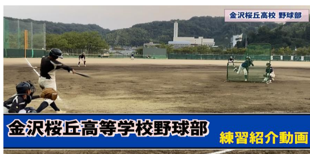
金沢桜丘高等学校野球部 練習紹介動画