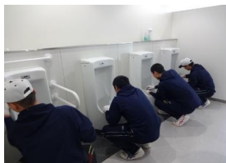
「トイレと心を磨く会」