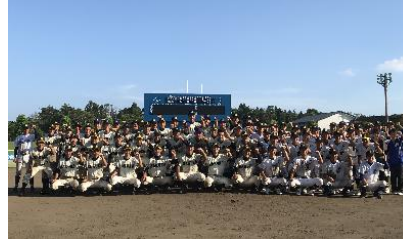
「東日本大震災被災地支援事業」(宮城県)