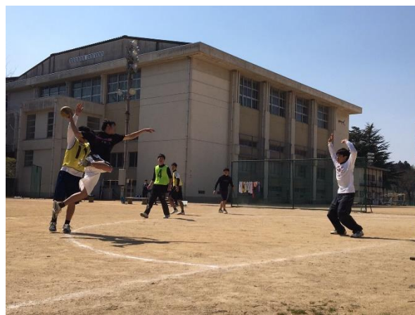
○激しい攻防の中に、細かい駆け引きがあるのがハンドボールです。