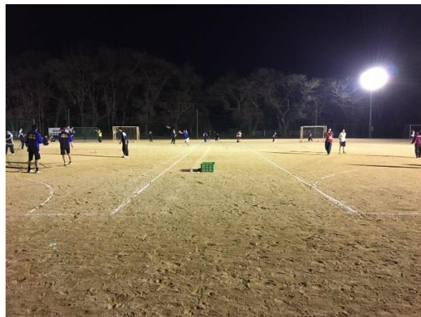
○選手が主体的にトレーニングを組み立てます。 (春合宿での個人練習の様子)