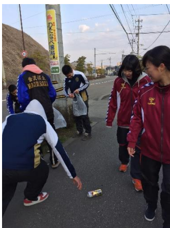
○学校周辺の清掃活動の様子