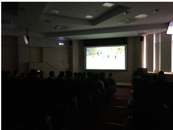
○新校舎の設備を活用したミーティングの様子。