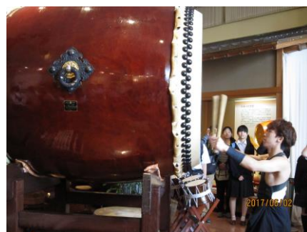
浅野太鼓で実演を見学しました。