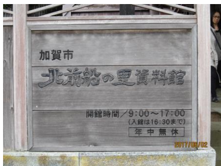
加賀市北前船の里資料館を訪れました。