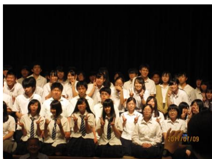
民家の甲子園に参加し、記念写真撮影です。