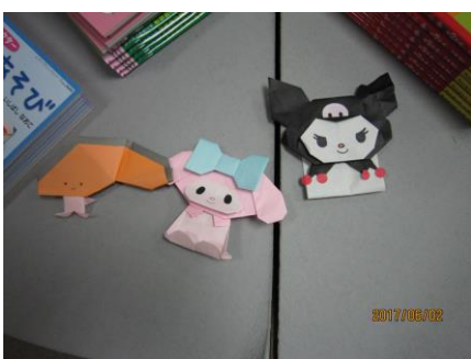
折紙博物館では様々な展示がされていました。