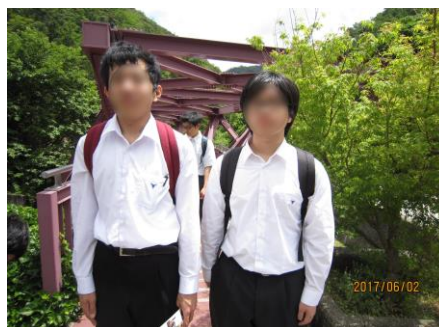
あやとり橋と一緒に記念撮影。