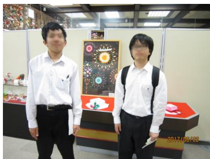
日本折紙博物館と一緒に記念撮影。