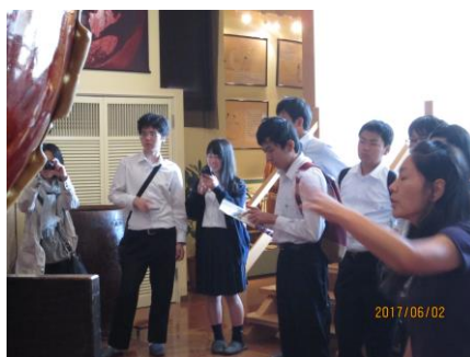
浅野太鼓で説明を聞いています。