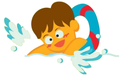
遊泳中の事故 <2015年～2019年>