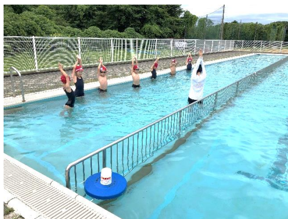
ストリームラインを確認して「けのび」に挑戦