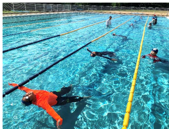
着衣で背浮き。できるだけ長く。(6年生)