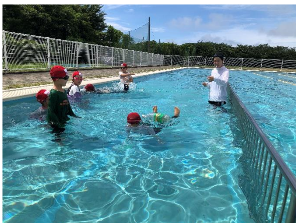
着衣でペットボトルを抱えた浮く体験(2年生)