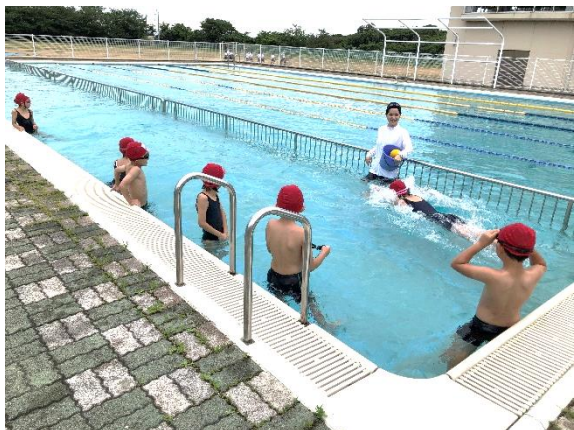
プールでのソーシャルディスタンス