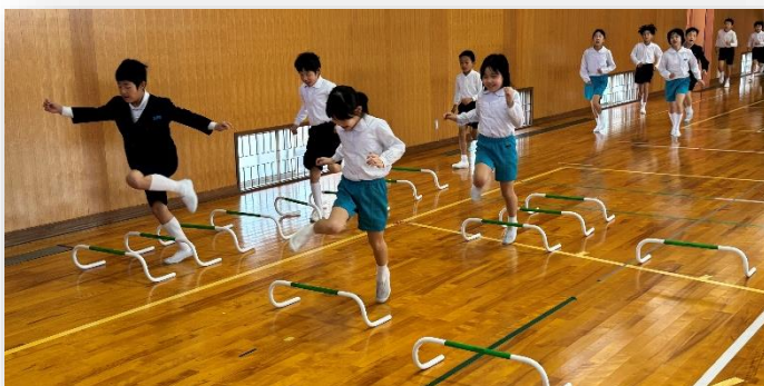
おはようランニング

今年度のおはようランニングは、ひと工夫をしています。ミニハードルを並べてリズムカルに越えていきます。子どもたちは楽しそうにタンタンターンと越えながら走っています。楽しく続けて、体力向上です。