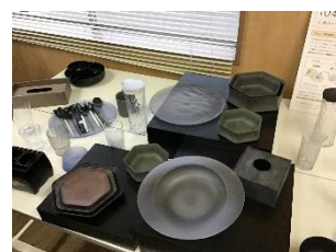
石川樹脂工業の製品