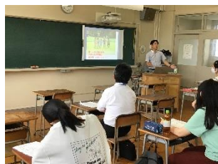
岸グリーンサービス